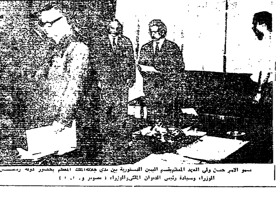
سمو الامير حسن ولي العهد العظم يقسم المين السنوية بين يدي جلالة الملك العظم بحضور دولة رئيس الوزراء وسيدادة رئيس الديوان الملكي والوزراء

جدة - « الدستور » - ١٠٠ - اقليمية - جرت محادثات ودية واخوية بين جلالة الملك الحسين و جلالة الملك فيصل في قصر الضيافة في جدة اثر وصول الامام فيصل الاردني مباشرة الى جدة ظهر امس من عمان . استقبل حافل وقد جرى لجلالة الحسين استقبال رسمي وشعبي حافل في مطار جسده اشترك فيه جلالة الملك فيصل واصحاب السمو الملكي الامراء والوزراء وكبار رجال الدولة والجيش وجمع حاشدين المواطنين . ولدى نزول جلالة الحسين من الطائرة استقبله جلالة الملك فيصل فتعانقا عنان الاخوة بين هاتفتين المواطنين بحياة الزعيمين العربيين واطلقت التهنئة احدي وعشرين طلقة لجلالة الحسين . وبعد ذلك صانع الحسين سمو الامير خالد بن عبد العزيز ولي العهد نائب رئيس الوزراء وقدم لجلالة اعضاء الوفد المرافق الى جلالة الملك فيصل . وبين هاتفتين المواطنين انجح المعاملان الى منصة الشرف وعزفت الموسيقى السلامين الملكيين الاردني والسعودي ثم توجه الحسين والفيصل الى حيث وقف كبار المسؤولين من اصحاب السمو الامراء والوزراء وكبار رجال الدولة وانباء الجالية الاردنية فصاحبههم الحسين وبعد استراحة قصيرة اسفل الفيصل والحسين السيارة الى قصر الضيافة حيث اجريا محادثات ودية . وقد وصل في ممة جلالة الحسين دولة السيد بهجت القاهوني رئيس الوزراء والكثير شوكت الساطبي القسبي الخاص والفرق الركن علمر خاشي رئيس اركان الجيش العربي الاردني والسيد زيد الرفاعي الامين العام للديوان الملكي الهاشمي . حفلة العشاء وقد اقام جلالة الملك فيصل مساء امس حفلة عشاء على شرف جلالة الملك الحسين العظم دعي اليها كبار رجال الدولة السعودية والوفد المرافق لجلالة الحسين . البقية على الصفحة السادسة عمود ٥